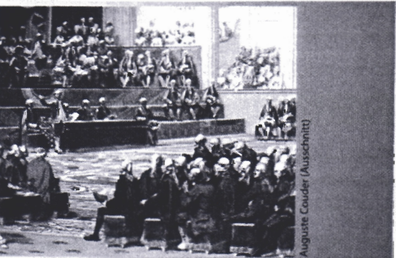
Auguste Couder (Ausschnitt)